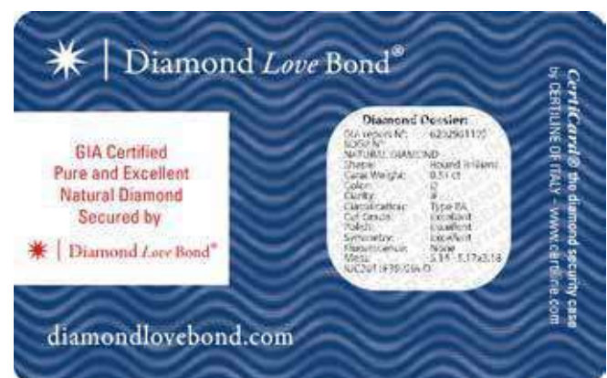
Scheda inferiore a sigillo chiusa con CERTISTOP® applicato