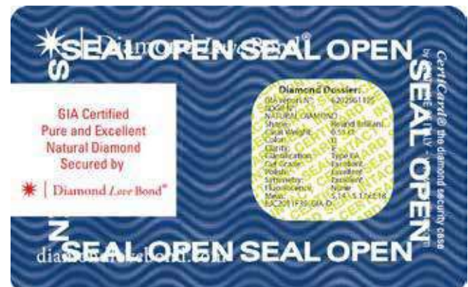
Scheda inferiore a sigillo dopo l'apertura della CertiCard ®