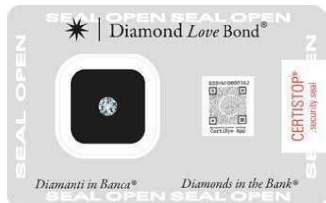
Scheda superiore aperta, con alloggiamento per il diamante e finestra trasparente per il certificativo cartaceo, con CERTISTOP® applicato e CERTIEYE